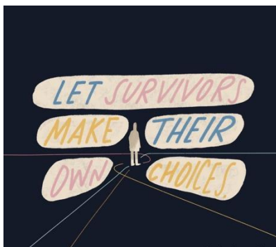
Рис. 1.

Термін «орієнтований на постраждалих» походить зі сфери роботи активістів/ок із захисту прав жінок, що надають допомогу та послуги жінкам, що постраждали від сексуального насильства та насильства з боку інтимного партнера. 2 Зараз цей загальний термін використовується в усьому світі в контексті надання послуг протидії ГЗН і означає чуйний, співчутливий підхід до роботи з постраждалими від ГЗН, що зосереджується на забезпеченні їхньої безпеки та сприянні вільного виявлення їхньої волі . Орієнтований на постраждалих підхід запозичено з феміністської, соціальної роботи й травмо-інформованої теорії та практики. 3 Це процес допомоги, який за своєю метою є терапевтичним – спрямованим на сприяння зціленню та одужанню – і політичним – спрямованим на виправлення патріархальних систем, норм і практик, які є причиною міжособистісних і системних форм ГЗН. 4 Ці терапевтичні та політичні цілі є взаємопов'язаними й досягаються разом в процесі роботи надавача послуг із постраждалими.